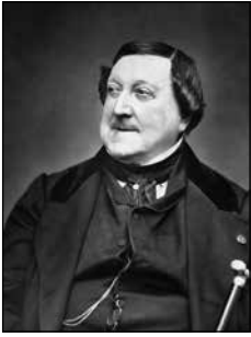
Gioachino Rossini, 1865.

Wer den Namen Rossini hört, denkt weniger an kirchenmusikalische Meisterwerke, als vielmehr an große italienische Oper: an IL BARBIERE DI SIVIGLIA und LA CENERENTOLA, TANCREDI oder L'ITALIANA IN ALGERI. Halb Europa versetzt Gioachino Rossini seit seinem Durchbruch 1813 in einen wahren Rausch. Wie wenige