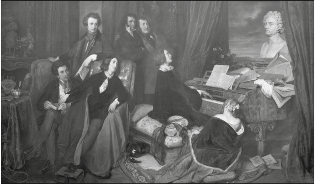
In einem Umfeld wie diesem entstand Rossinis Messe: Alexandre Dumas, Victor Hugo, George Sand, Niccolò Paganini, Gioachino Rossini, Franz Liszt (am Klavier), Marie d'Agoult (von links nach rechts), Gemälde von Joseph Danhauser 1840

Also legt er lieber selbst Hand an, verbietet aber öffentliche Aufführungen zu seinen Lebzeiten. Er bevorzugt die ursprüngliche, kleine Besetzung. Vielleicht spielt auch mit, dass er die Messe, ähnlich wie die „Péchés de vieillesse“, für Freunde komponiert hat, und nicht für die Öffentlichkeit.