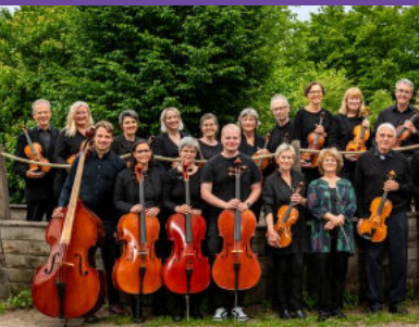
Doppelkonzert bei Zachäus am Freitag: 19