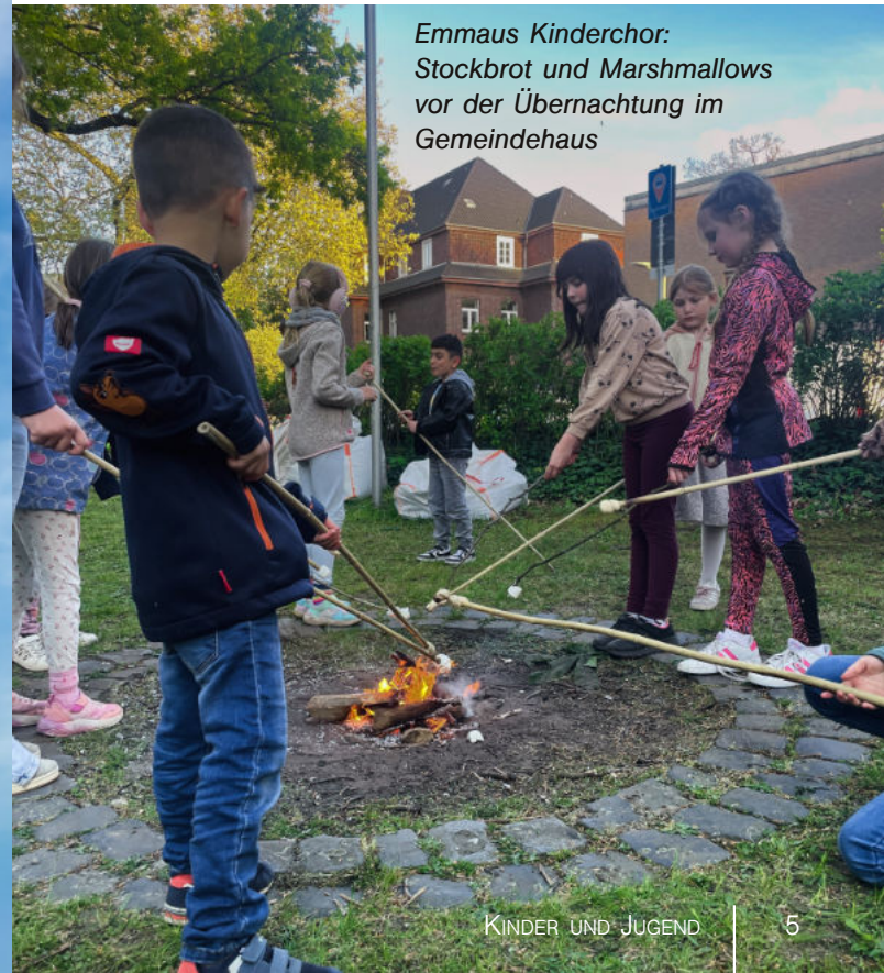
Emmaus Kinderchor: Stockbrot und Marshmallows vor der Übernachtung im Gemeindehaus

Der Emmaus Kinderchor wird auch beim Gemeindefest am 28. Juni um 16.00 Uhr auftreten.