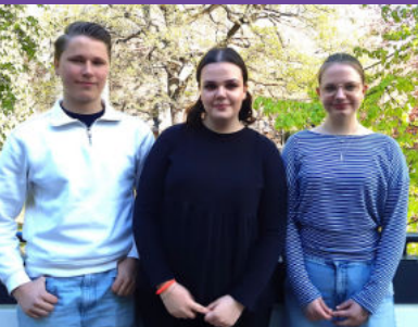
Neuer Vorstand der Ev. Jugend 11