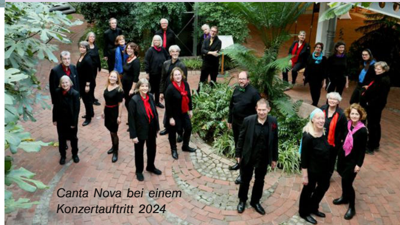
Canta Nova bei einem Konzertauftritt 2024