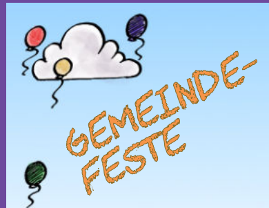
Gemeindefeste in Emmaus & Zachäus 12/13