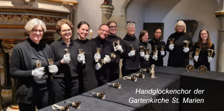
Handglockenchor der Gartenkirche St. Marien