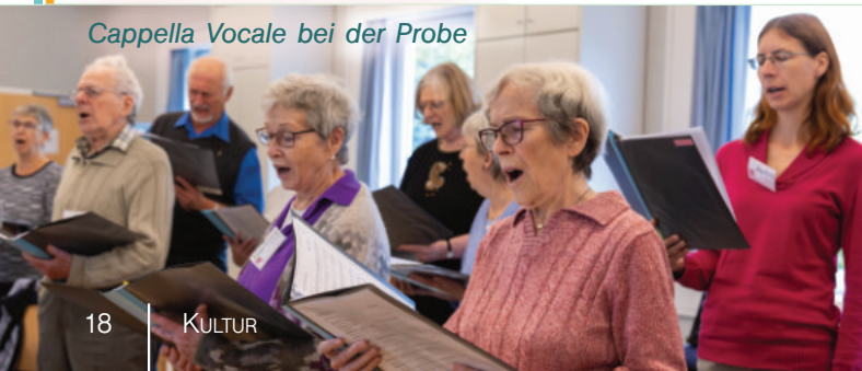
Capella Vocale bei der Probe

Hereinspaziert zu den offenen Proben der Capella Vocale! Wer Freude am Singen hat, ist herzlich willkommen – ganz gleich welchen Alters oder mit welcher Erfahrung. Gesungen werden einfache bis mittelschwere Chorsätze. Anmeldung bei Chorleiter Harald Röhrig (s. S. 45). Oder einfach spontan dabei sein!