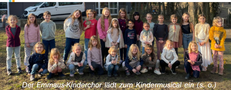
Der Emmaus-Kinderchor lädt zum Kindermusical ein (s. o.)

tion Humor erzählt das Musical die biblische Geschichte von Bileam und seiner Eselin, die auf König Balak und auf das Volk Israel stoßen. An einigen Stellen ist auch das Publikum eingeladen mitsingen . So wird die Aufführung zu einem gemeinsamen Erlebnis für Groß und Klein, zu dem Sie herzlich eingeladen sind.