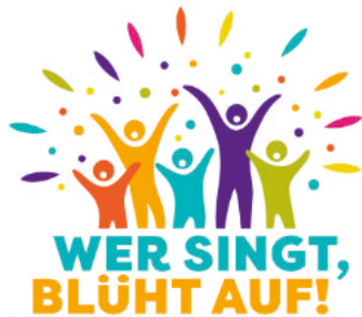
Mitsingfestival und mehr