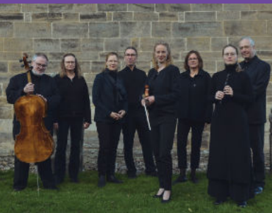
klang RAUM – raum KLANG